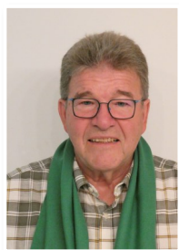
Anton Boos Pressereferat | Pressesprecher Resort Öffentlichkeitsarbeit

Email: schriftfuehrer@rheumaliga-arge-wm.de